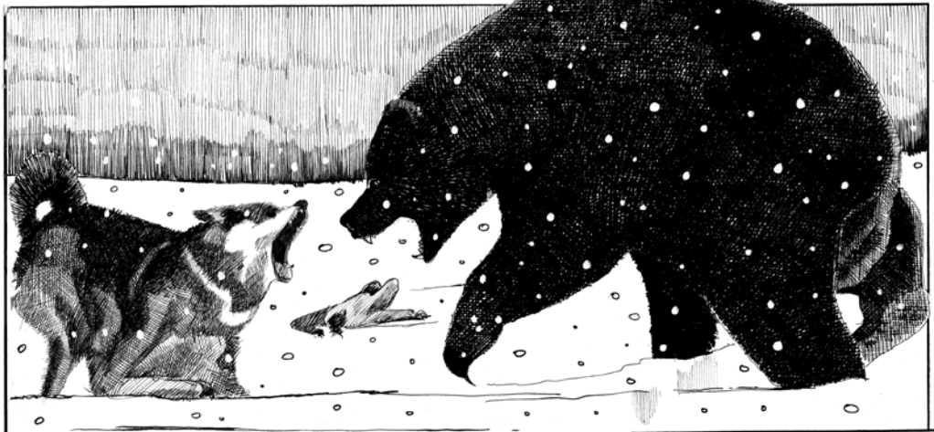
On laissera les ours et les loups se disputer les cadavres des canailles tchekistes